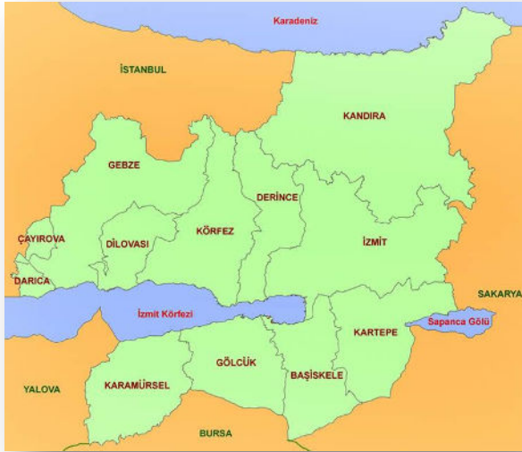
KOCAELİ İLÇELERİ HARİTASI

Karamürsel, Kocaeli İli'nin Marmara denizine kıyısı olan İzmit Körfezinin güney batısında yer alan en eski ilçelerden biridir.